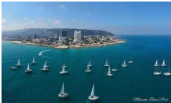
עמוד 4 מתוך 4